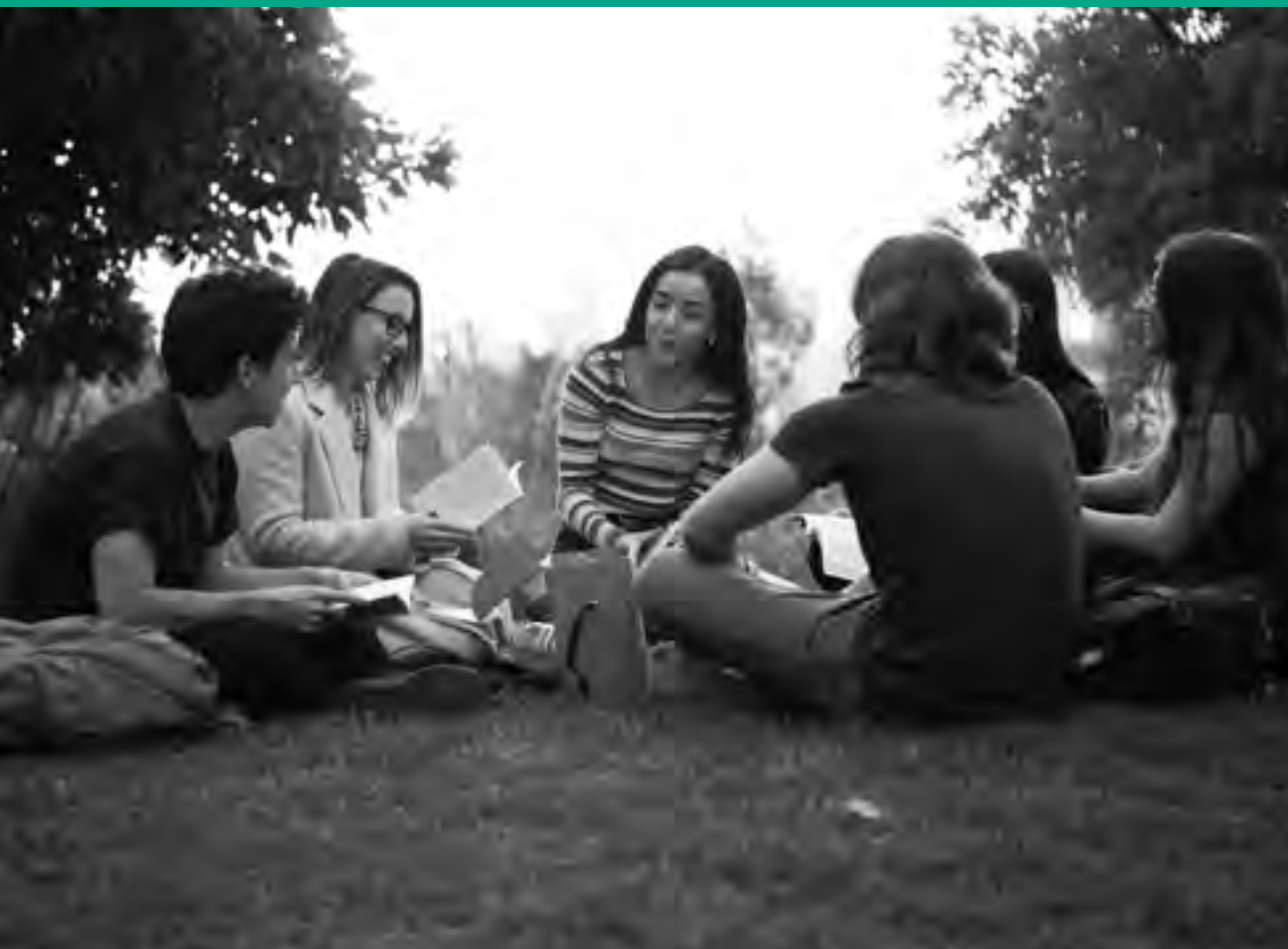
Clase Core Curriculum UAI.

LA UNIVERSIDAD ADOLFO IBÁÑEZ (UAI) ENTREGA UNA EDUCACIÓN BASADA EN LOS PRINCIPIOS DE LA LIBERTAD, DE AHÍ SU LEMA “PENSAR CON LIBERTAD”, Y EN LA RESPONSABILIDAD PERSONAL, QUE PERMITE A SUS ESTUDIANTES DESARROLLAR LA TOTALIDAD DE SU POTENCIAL INTELECTUAL Y HUMANO. PARA LOGRAR ESTO, LA UAI ASUME EL COMPROMISO DE IMPARTIR UNA FORMACIÓN PROFESIONAL CON ALTOS ESTÁNDARES ACADÉMICOS, CONTRIBUIR A EXPANDIR LAS FRONTERAS DEL CONOCIMIENTO A TRAVÉS DE INVESTIGACIÓN DE ALTO NIVEL Y TRANSFERIR ESTOS CONOCIMIENTOS PARA BENEFICIO DE LA SOCIEDAD.